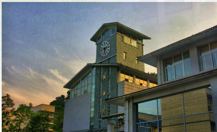
都江堰校区图书馆

与美国、英国、法国、德国、加拿大、俄罗斯、日本、韩国等 32 个国家和地区（包含港澳台）的 100 多所高校或科研机构建立了交流与合作关系，共签署了 170 余项交流合作协议，与国（境）外知名高校开展了“2+2”“3+1”“3+1+X”“4+1”等模式的联合培养项目。建有省部级国际合作联合实验室 1 个、国别和区域研究中心 1 个。学校是全国首批有条件接受留学生的 200 所高校之一，是国家建设高水平大学公派研究生项目签约高校，中国政府奖学金生培养高校，是“粮食安全”教育科技创新联盟创始高校，曾被国家 6 部委评为全国留学回国人员先进工作单位，先后被国家外专局评为引进国外智力先进集体、外国文教专家管理工作先进单位。